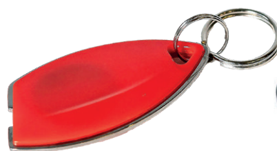
Transponder als Schlüsselanhänger

ist mit dem Infoterminal und unseren speziellen fälschungssicheren Transponder-Etiketten ein Kinderspiel.